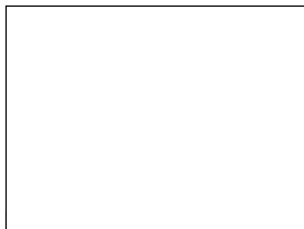
0012 White Matt