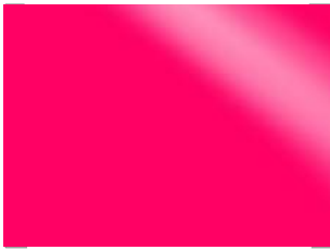
0844 Fuxia Fluo