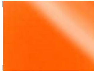
0845 Orange Fluo