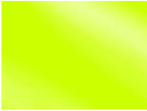
0842 Yellow Fluo