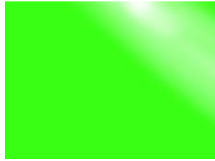
0843 Green Fluo