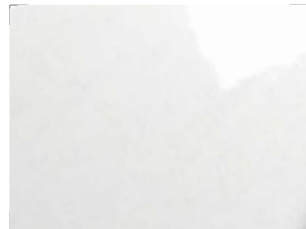
0094 White Shiny