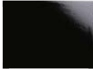
0067 Black Shiny