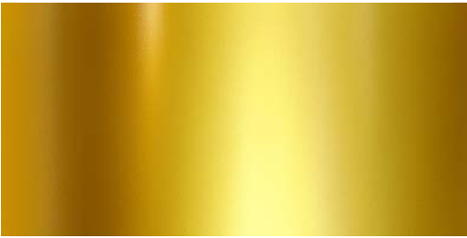
ZF101 - Gold