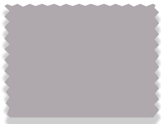
1265 Pearl Grey