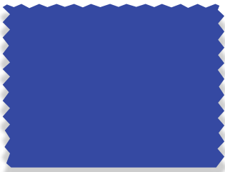
1349 Framis Blue