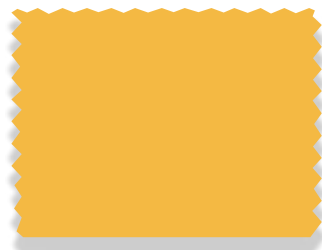
831 Corn Yellow